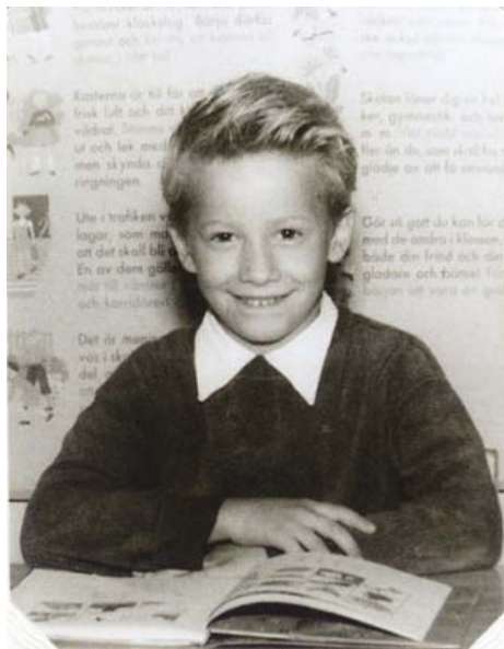
Skolans skräck eller tvärtom...

Det blev fel redan när jag började i första klass. Jag hade en opedagogisk lärarinna som luggade mig när jag inte var tyst eller satt still. Samtidigt var jag påfrestande. Bokstavskombinationer som ADHD och dysleksi var ju inte uppfunna utan spring i bena samt koncentrationssvårigheter var ”diagnosen” och sånt skulle stävjas. Det