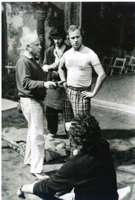
En tom spelplats med Peter Brook. Théâtre des Bouffes du Nord, 1981.

Jag sjöng upp torreadorarian. Peter bad mig att göra en kärleksscen med min långa skäggiga agent, absurt men det var bara att gilla läget. Så kände jag att koncentrationen höll på att svikta. Skärpning! Tittade lite försiktigt på klockan. Då hade vi hållit på i 1,5 timme! Han ville se hur jag jobbade inte hur jag lät. Jag fick rollen, hade ett kontrakt på åtta veckor som blev tre år med utsålda föreställningar i Paris och slutade på Broadway i New York. En otrolig upplevelse!